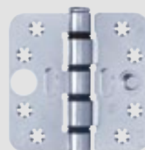
Smart Easyfix® Veiligheid