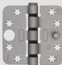
Smart Easyfix® Veiligheid Xtremecoat®