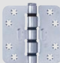
Smart Easyfix® Standaard